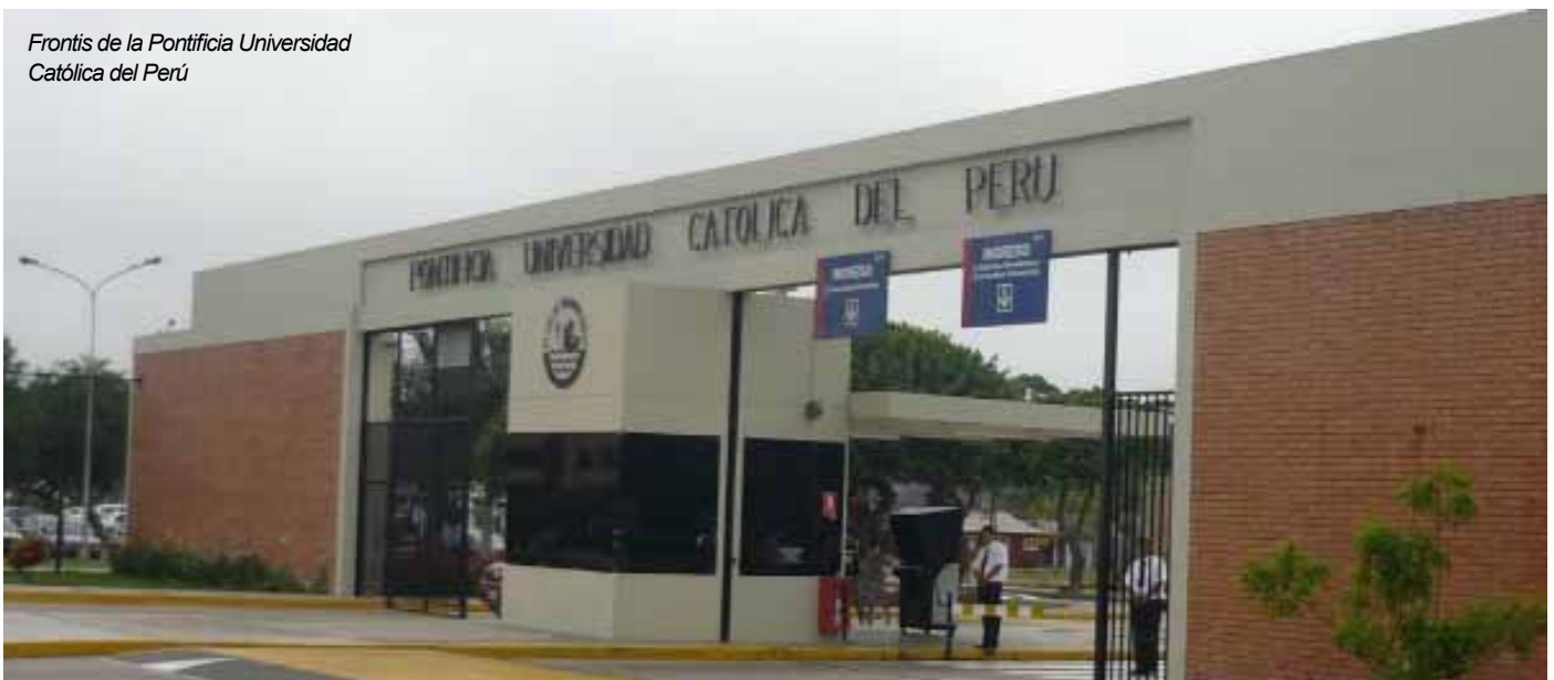
Frontis de la Pontificia Universidad Católica del Perú

El Cardenal Pío Laghi, Prefecto de la Congregación para la Educación Católica, señala que los estatutos presentados por la PUCP no presentan las propuestas de la Santa Sede. (Cfr. Archivo del Arzobispado de Lima. Folio II. Doc. N°139 )