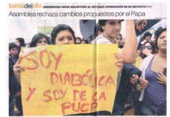
PUCP se enfrenta a la Iglesia Católica

En medio de las actividades orquestadas de agravio a la Iglesia, una alumna de la PUCP se declara públicamente “diabólica”. La fotografía la publica en portada el diario El Comercio, causando un gran asombro en la opinión pública. (Cfr. Portada del diario El Comercio del 27/09/2011 )