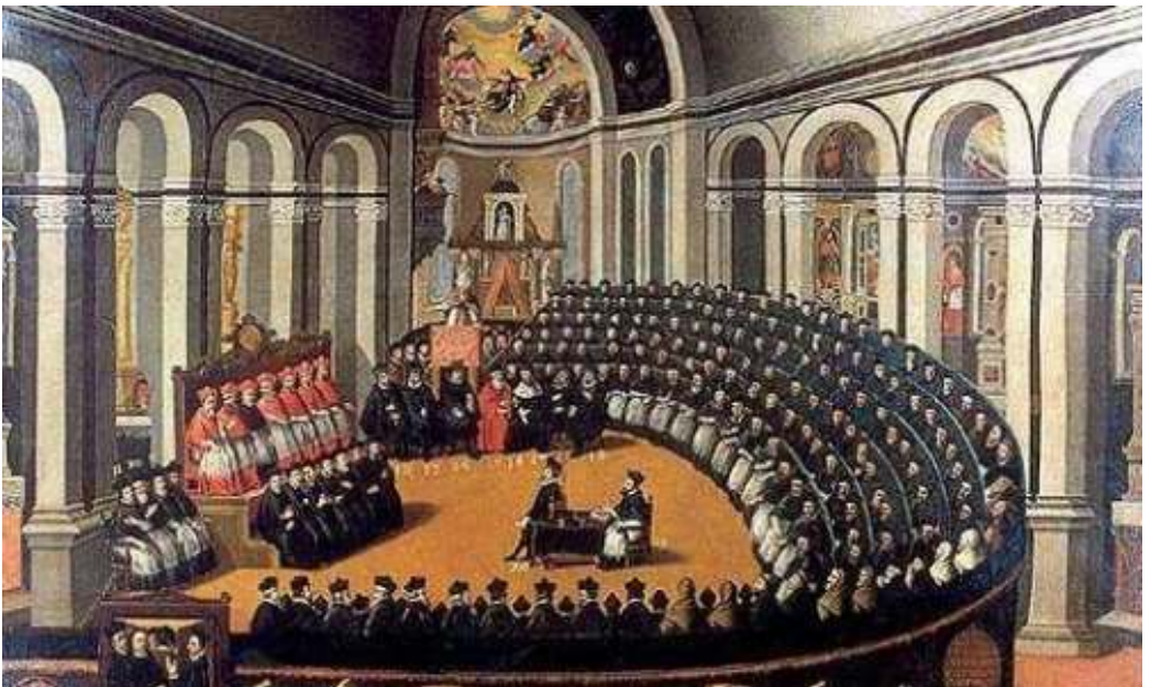
Aula Conciliar. Concilio de Trento. Pintura del S. XVII