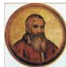
Urbano VII 1590-1590