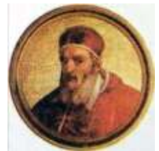
León XI 1605-1605