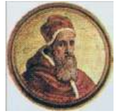
Inocencio IX 1591-1591