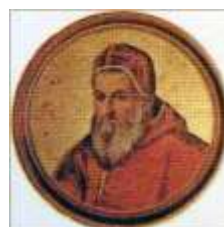
Sixto V 1585-1590