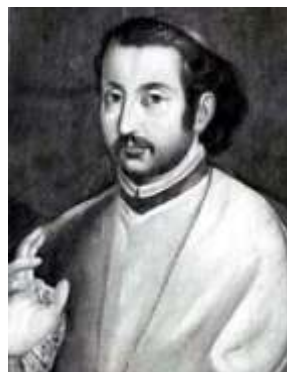
Ven. Juan de Palafox y Mendoza Obispo de Puebla de los Angeles (México) (1600-1659)

En este pasado siglo nos alumbró Dios a los Prelados, ofreciéndonos un ejemplar vivo de perfectos pastores en la vida admirable de san Carlos Borromeo, luz clarísima de Milán y Maestro verdaderamente de Obispo, cuya armonía, en su espiritual gobierno, es más fácil de admirar, que no de explicar. También para los obispos regulares señaló Dios por ejemplo a Santo Tomás de Villanueva, Arzobispo de Valencia, honor de España y de la gloriosa religión de San Agustín, cuyo espíritu, fervor y predicación es comparable a la de los mayores y primitivos Padres de la Iglesia.