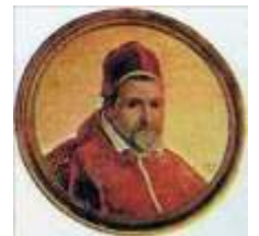
Pablo V 1605-1621

Sumos Pontífices que gobernaron la Iglesia durante el pontificado de Santo Toribio de Mogrovejo, Segundo Arzobispo de Lima