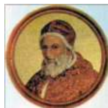
Gregorio XIII 1572-1585