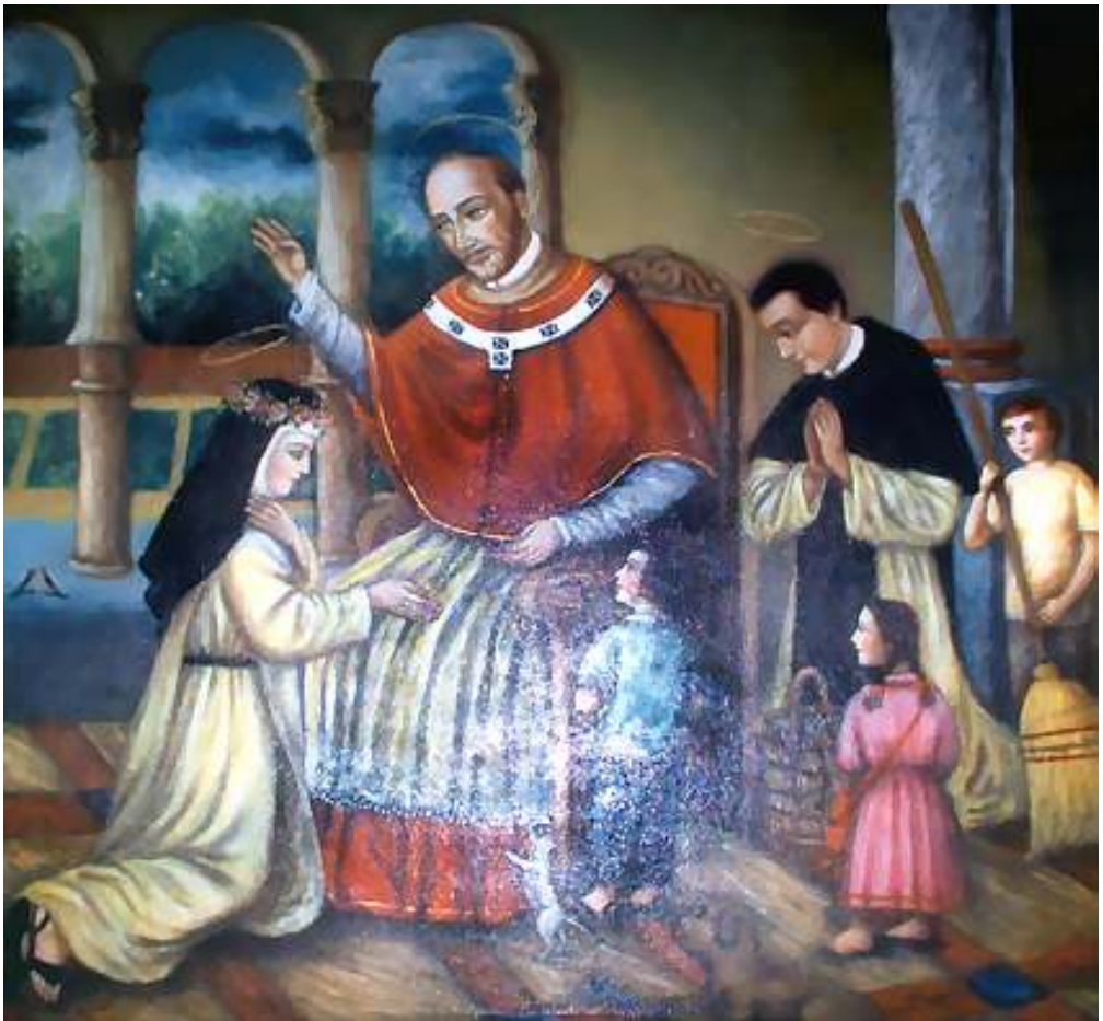
Santo Toribio con Santa Rosa de Lima y San Martín de Porres. Parroquia Santa María de Nazaret (Surquillo, Lima)

Cuando el Tercer Concilio Limense legisló que el sacramento de la Confirmación se debía conferir "a todos los cristianos bautizados, para que tengan fortaleza en la fe y ley de Dios contra sus enemigos" , se preparó el camino para acercar a niños y jóvenes a Cristo a través de los sacramentos. Así, entre los miles de confirmados por Santo Toribio, podemos encontrar a los jóvenes Rosa de Lima y Martín de Porres.