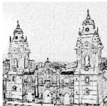
Basilica Catedral de Lima

El Tercer Concilio Limense se inauguró el 15 de agosto de 1582, fiesta de la Asunción de la Virgen. Reunidos los Padres conciliares y las autoridades civiles y religiosas, desde el Convento de Santo Domingo, partieron en solemne procesión hacia la Basílica Catedral de Lima. Presidía el cortejo conciliar el Arzobispo Metropolitano, Toribio Alfonso de Mogrovejo, acompañado de cuatro Obispos, el Virrey, la Audiencia y ambos Cabildos. Instalados en el recinto catedralicio, fray Antonio de San Miguel, Obispo de La Imperial (Chile) tuvo a su cargo el sermón de apertura. A continuación se leyeron las leyes eclesiásticas, todos hicieron la profesión de fe, y el Arzobispo Metropolitano anunció que las sesiones privadas se celebrarían en la Sala Capitulare y las sesiones públicas en la Basílica Catedral.