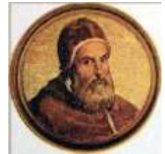
Clemente VIII 1592-1605