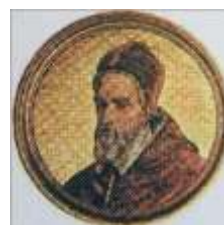
Gregorio XIV 1590-1591

Sumos Pontífices que gobernaron la Iglesia durante el pontificado de Santo Toribio de Mogrovejo, Segundo Arzobispo de Lima